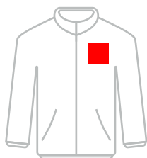
100 x 100 mm

Gebruik de grootte van je gekozen printpositie als de basis (qua maat) voor je ontwerp en benoem het bestand naar deze positie (bijvoorbeeld: borst.pdf):