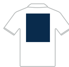
300 x 350 mm