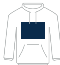
300 x 200 mm

Teksten: Lettipes omzetten naar lettercontouren of het Lettertype meesturen met het ontwerp.